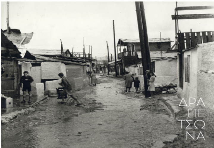
Εικόνα 3.

Το υλικό των πρωτογενών και δευτερογενών πηγών, κατάλληλα «φωτισμένο» από τον/την διδάσκων/ουσα μπορεί να αναδείξει τη συμβολή των εργατριών στην εξέλιξη της συγκεκριμένης βιομηχανικής μονάδας αλλά και στην ανάπτυξη της κοινωνικής ζωής της περιοχής, ιδίως μετά τη Μικρασιατική Καταστροφή και την άφιξη των προσφυγισσών, που πολλές από αυτές εργάστηκαν στην ΑΕΕΧΠΛ («Λιπάσματα») και εγκαταστάθηκαν σε προσφυγικές κατοικίες σε κοντινή απόσταση από το εργοστάσιο. Πάνω από 25.000 πρόσφυγες εγκαταστάθηκαν σε μια μικρή περιοχή από τον Άγιο Διονύσιο, στο λιμάνι του Πειραιά, έως και το εργοστάσιο, σε συνθήκες εξαιρετικά αντίξοες, χωρίς κρατική μέριμνα για ζητήματα ύδρευσης ή αποχέτευσης.