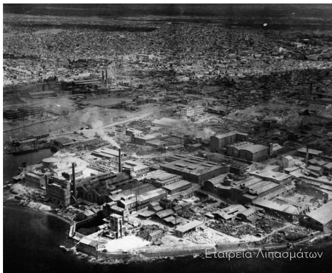
Εικόνα 1. Η βιομηχανική περιοχή της Εταιρείας Λιπασμάτων