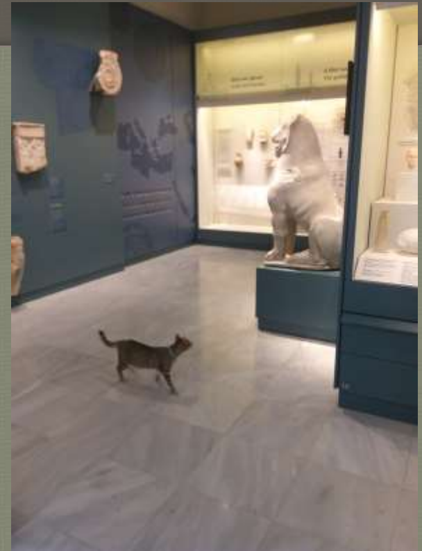
Εύη Πίνη Αρχαιολόγος - Συγγραφέας