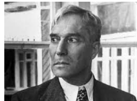
Μπόρις Πάστερνακ 1890-1960